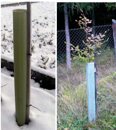
Obr. 1: Ukázka různých typů plastových chráničů/Sample of various types of plastic treeshelters