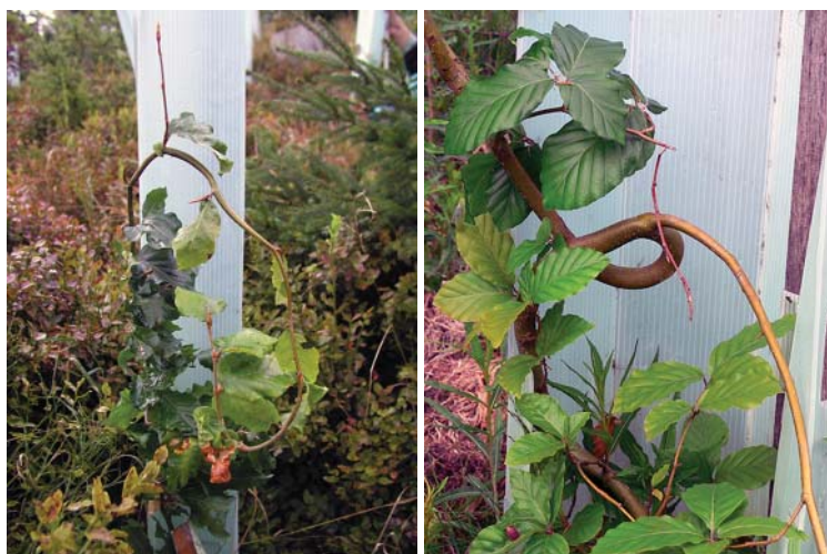
Obr. 4: Deformace výhonů způsobené nežádoucím ohýbáním terminálních výhonů buku v chráničích/Deformation of shoots caused by undesirable curving of beech terminal shoots in treeshelters