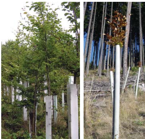
Obr. 5: (vlevo) Růst korun buku nad chrániči / (at left) Growth of beech crown over tree-shelters

let tento poměr vrací na obvyklou hodnotu 0,6 až 0,8 (obr. 5). Současně se zvýšením intenzity tloušťkového přírůstu se zvyšuje i intenzita rozrůstání kosterních kořenů do prostoru kolem výsadbové jamky.