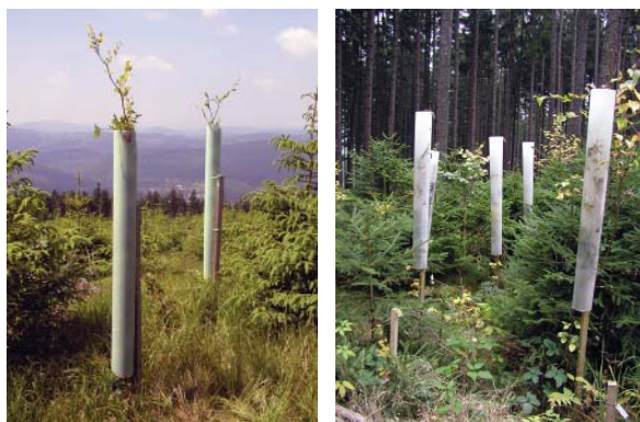
Obr. 7: „Zvedání“ chráničů na dostatečně dlouhých opěrných kůlech pro ochranu vyšších částí korun před okusem vysokou zvěří/“Lifting” of treeshelters on sufficiently high supporting posts for protection of higher parts of crowns against game browsing