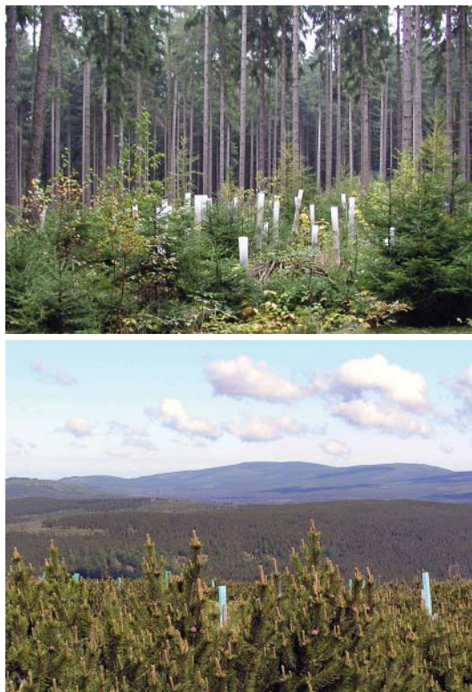
Obr. 3: Příklad použití plastových chráničů při skupinových výsadbách a prosadbách/ Examples of using plastic treeshelters for group plantings