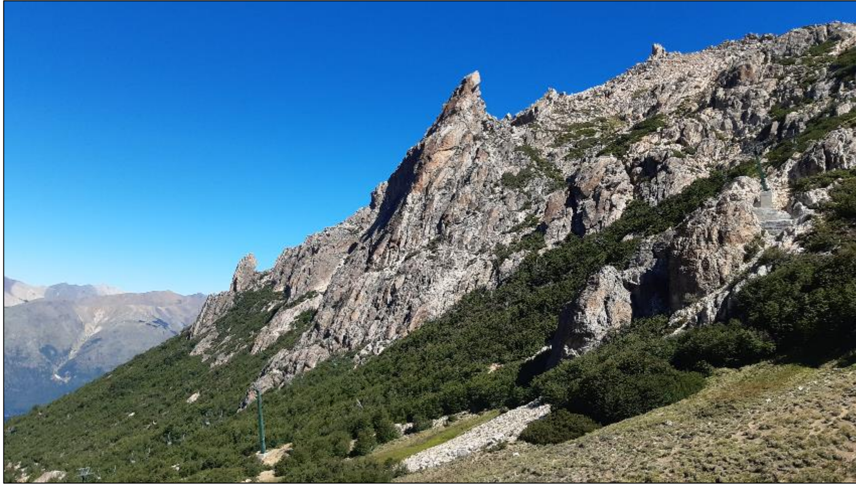
Masiv Cerro Catedral