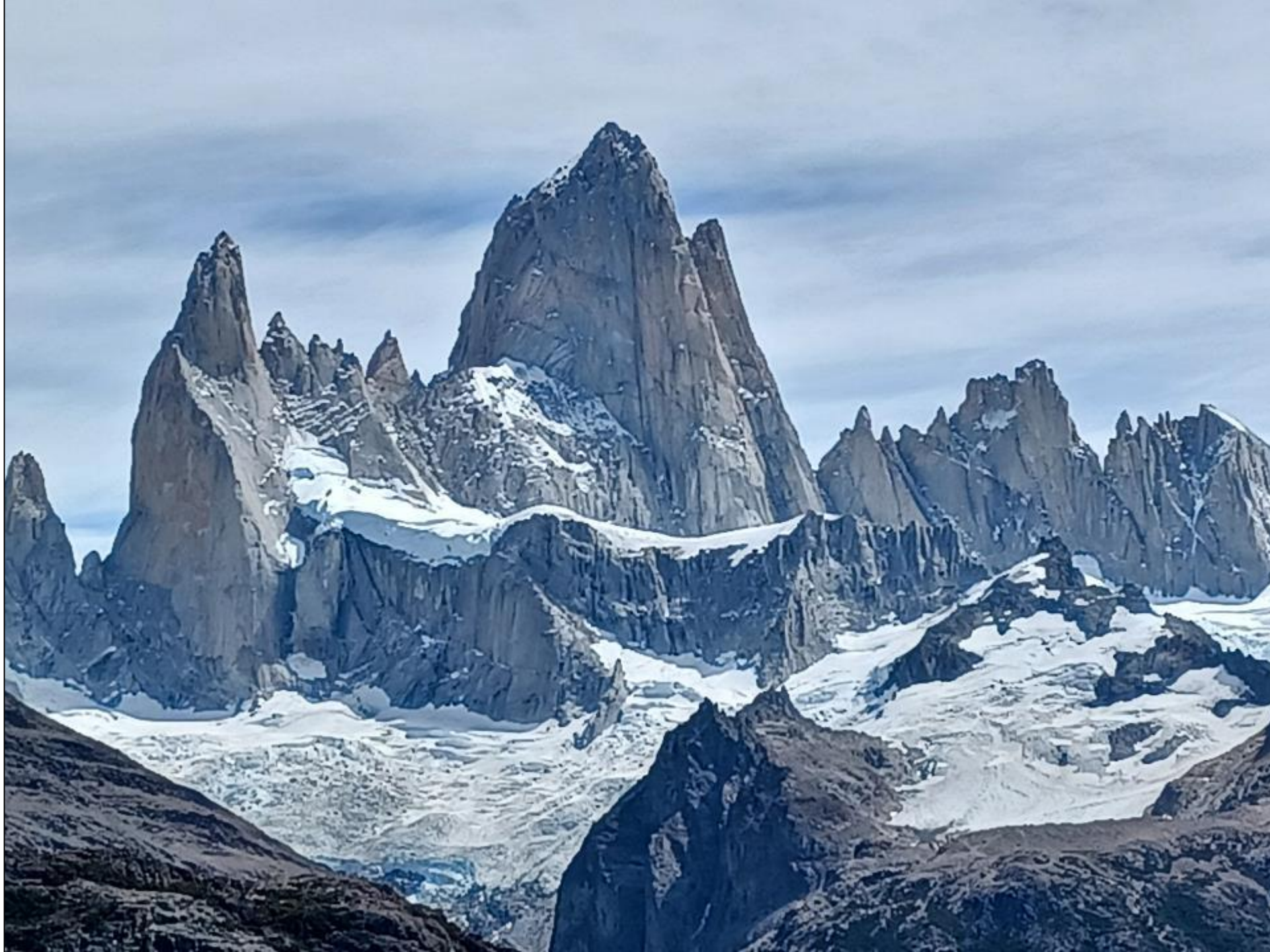
Monte Fitz Roy 3405 m n. m.