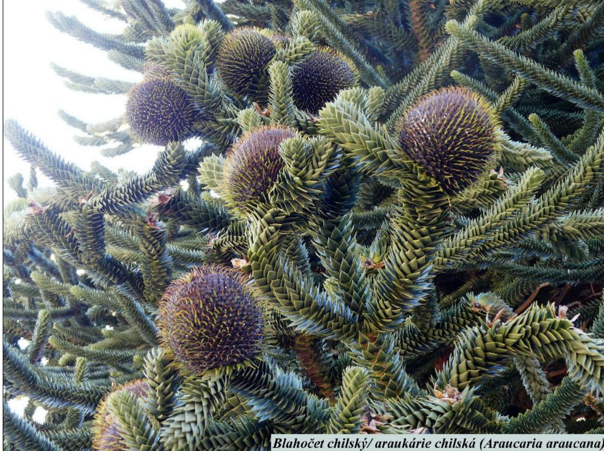
Blahočet chilský/ araukárie chilská (Araucaria araucana)