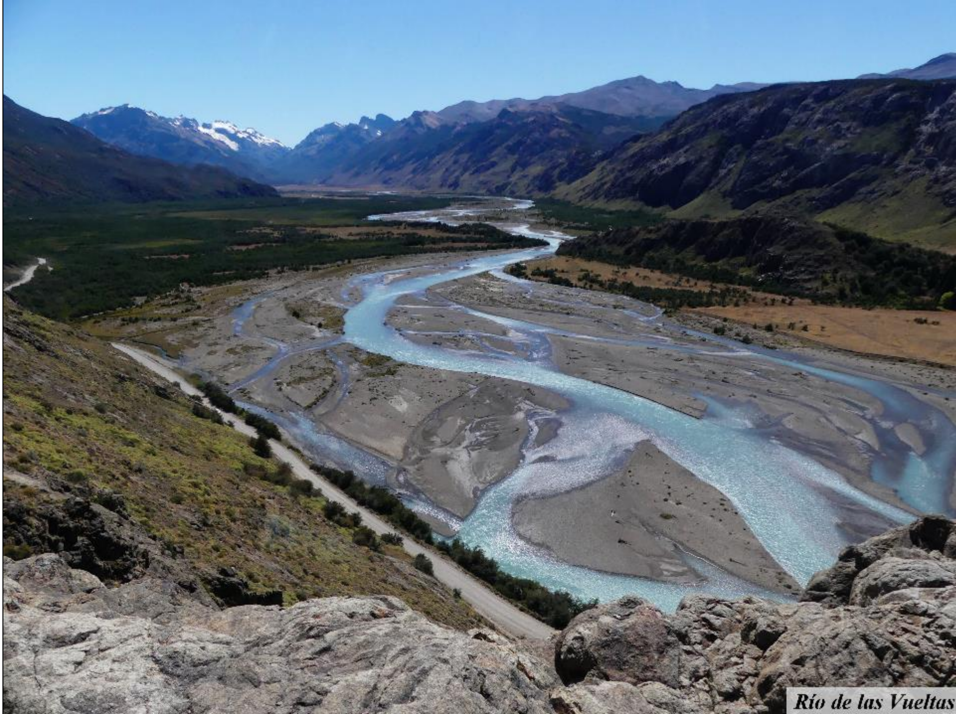
Río de las Vueltas