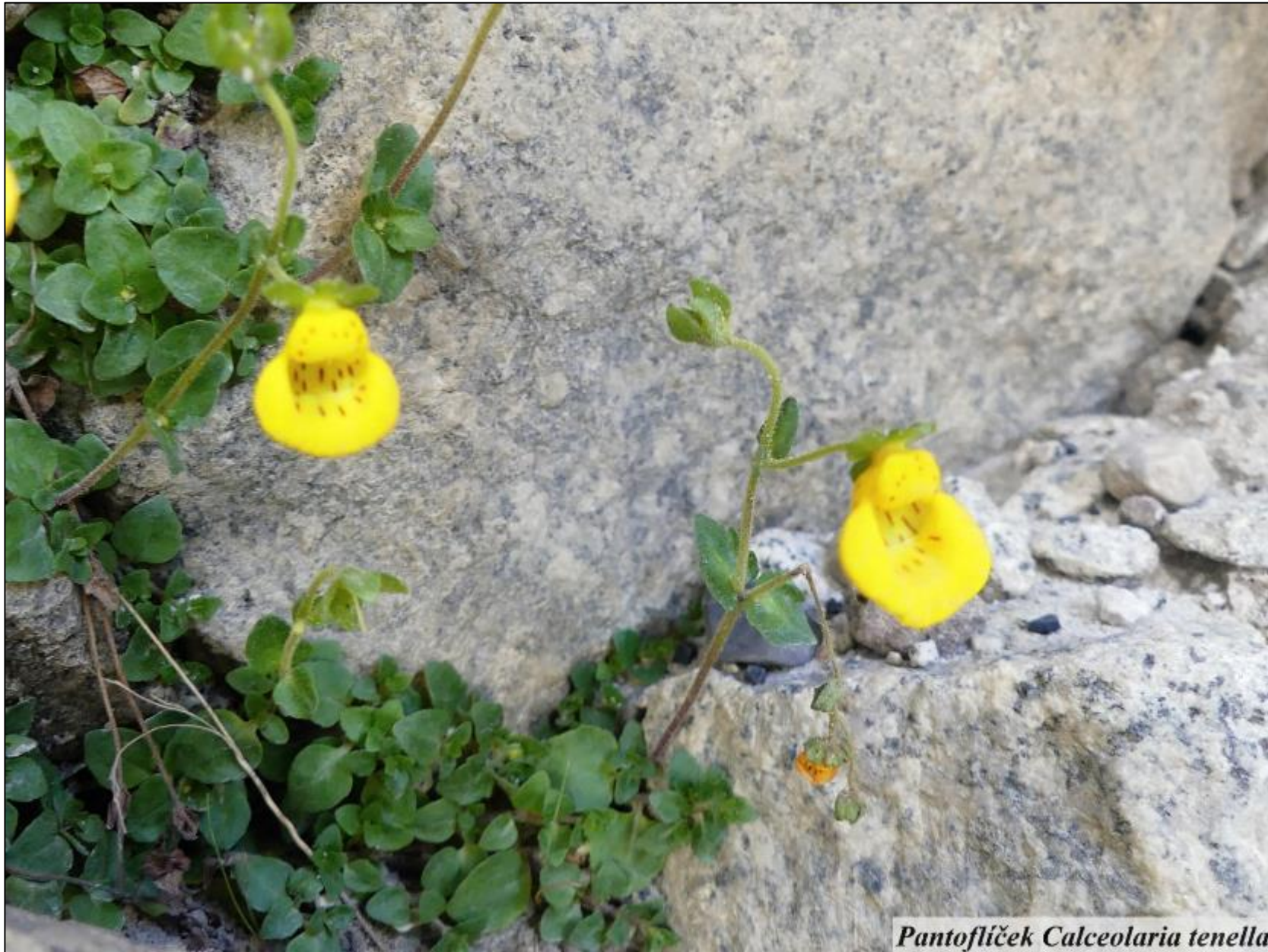
Pantoflíček Calceolaria tenella