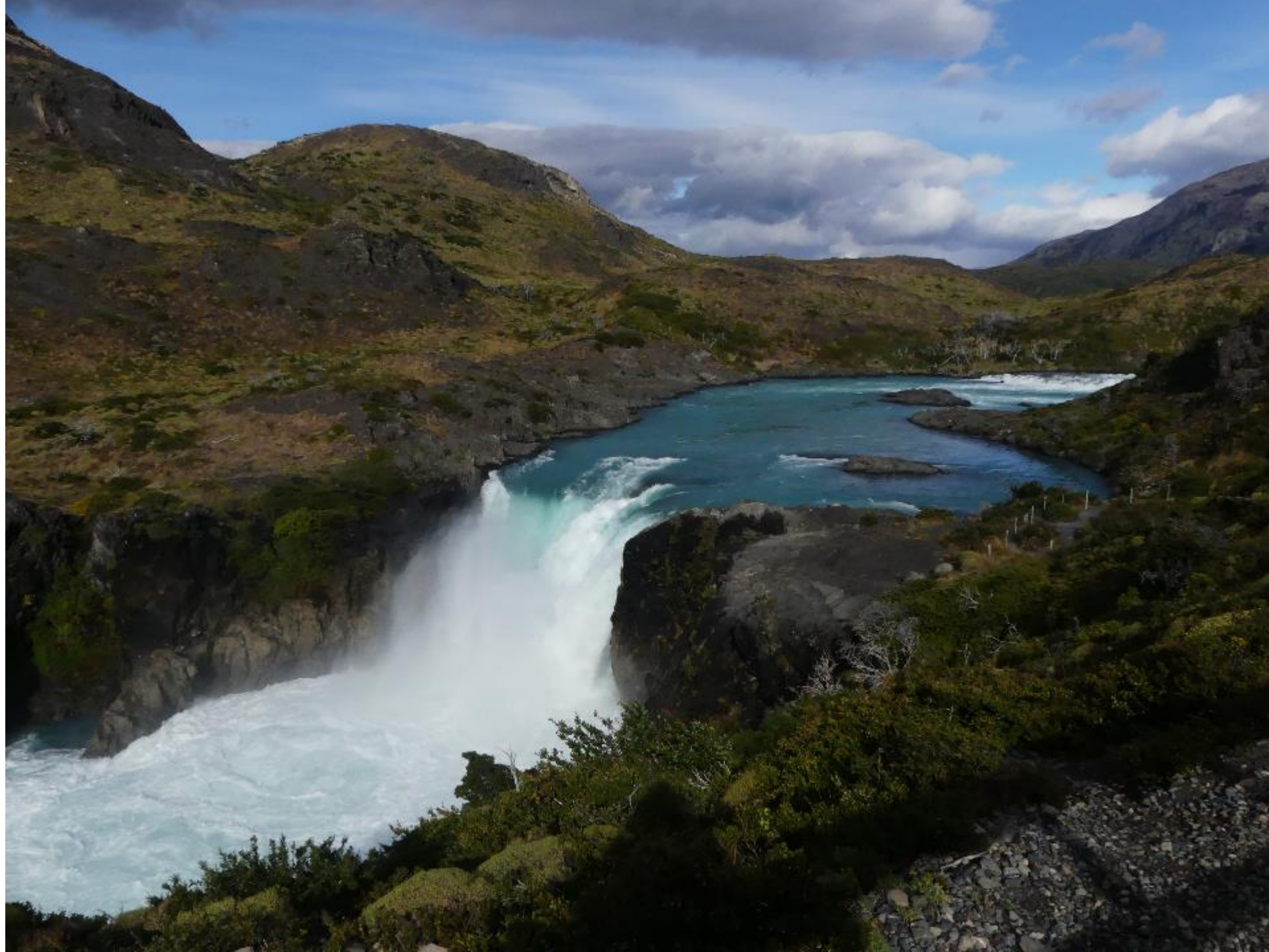
Vodopád Salto Grande