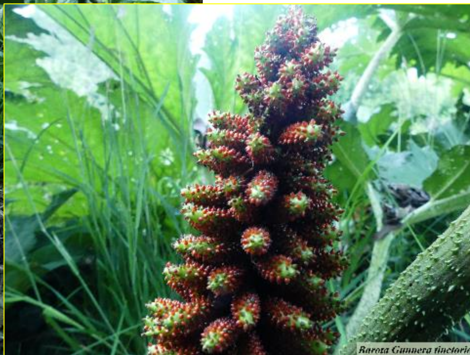
Batoro Gunnera tinctoria