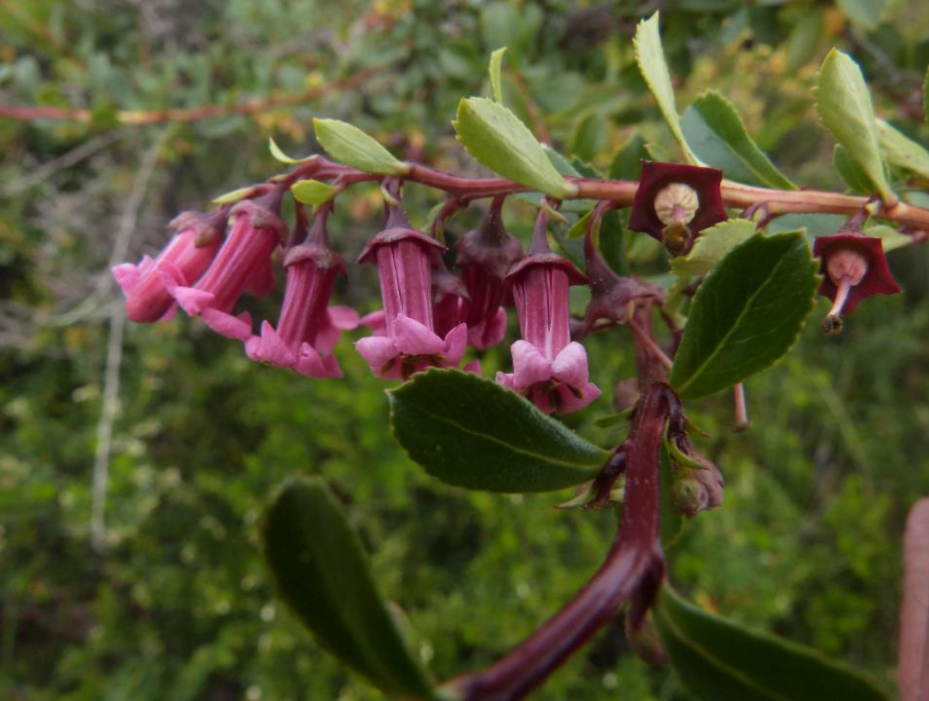
Escallonia rubra (zábluda červená)