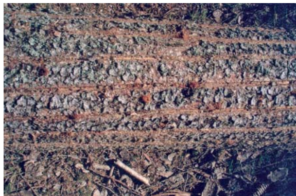
Obr. 3: Připravený lapák s poškrábanými pruhy kůry