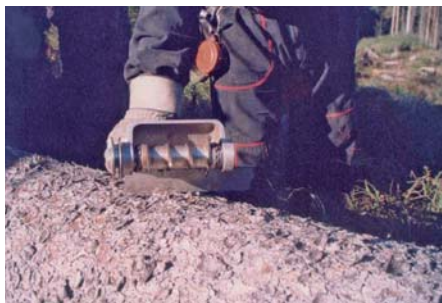
Obr. 2: Adaptér na motorovou pilu, firma Günter, Německo